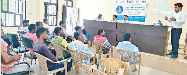
नारनौल। कार्यशाला में मौजूद सीवरमैन।