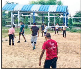
नारनौल। वॉलीबॉल प्रतियोगिता में भाग लेते खिलाड़ी।