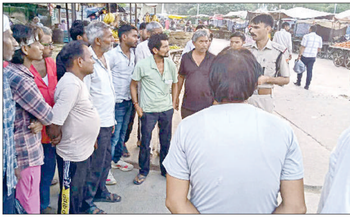
नारनौल। सार्वजनिक स्थान पर आमजन को साइबर क्राइम के प्रति जागरूक करती पुलिस।

इस अभियान में पुलिस ने साइबर सुरक्षा के साथ साथ एक और महत्वपूर्ण सामाजिक संदेश भी दिया। पुलिस ने युवाओं व आम जनता से नशे की लत से बचने और एक