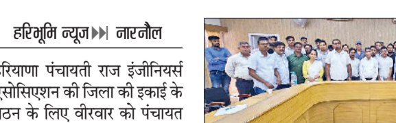
नारनौल। एसोसिएशन के पदाधिकारी व सदस्य।