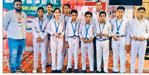
महेन्द्रगढ़। विजेता बच्चों को सम्मानित करते हुए।