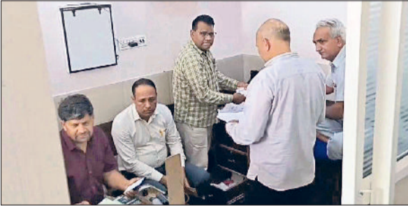
नांगल चौधरी। निजी अस्पताल में छापेमारी करके चिकित्सक से पूछताछ करती सीएम फ्लाइंग।

जानकारी के मुताबिक बीते आठ से 10 महीनों से नांगल चौधरी में कई निजी अस्पतालों में मापदंड पूरे नहीं होने की शिकायत विभाग