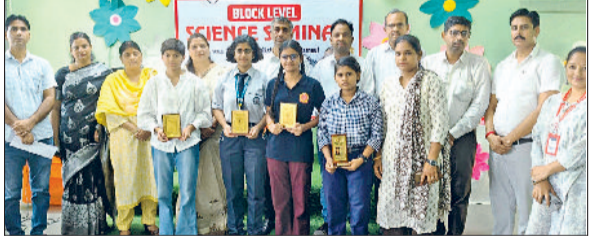
नारनौल। प्रतियोगिता के विजेता विद्यार्थी।