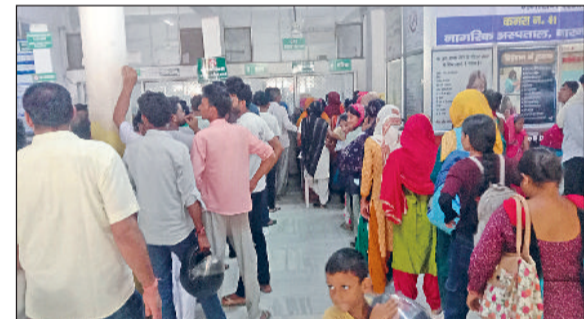
नांगल नौल। नागरिक अस्पताल में इलाज के लिए लगी मरीजों की लाइनें।

प्रदेश सरकार ने वर्ष 2020 को जारी गजट नोटिफिकेशन को एक अगस्त से सरकारी अस्पतालों में लागू कर दिया है। सरकारी अस्पतालों में अब सभी टेस्ट मुफ्त भी नहीं होंगे, जबकि 75 तरह की लैब जांच के लिए मरीज को 25 से 700 रुपये तक शुल्क देना होगा। इतना ही नहीं, अब मोर्चरी में डेडबॉडी रखने के लिए 300 रुपये प्रतिदिन के हिसाब से शुल्क अदा करना होगा। यह नई व्यवस्था प्रदेशभर के सरकारी अस्पतालों में लागू कर दी गई है और अब नए मरीज इन्हीं शुल्कों के आधार पर भर्ती किए जा रहे हैं। इससे स्पष्ट है कि अब आम आदमी के लिए सरकारी अस्पताल में इलाज महंगा हो गया है। पहले केवल पांच रुपये पर्ची के लगते थे, लेकिन अब टेस्ट से लेकर बेड तक के लिए शुल्क देना होगा।