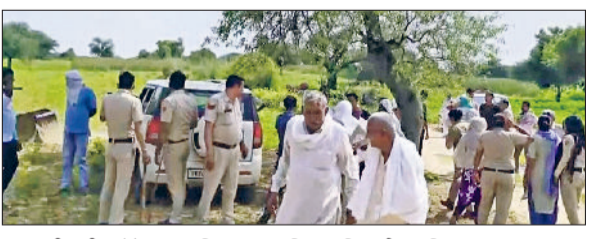
सतनाली मंडी। मोके पर उपस्थित प्रशासनिक अधिकारी व पुलिस।

ब्लड कंफेनेट्स सीटी/एमआरआई ईएसडब्ल्यूएल लेजर थरेपी हेमोडायलिसिस कैथ लैब प्रोसिजर एज पर नाको पब्लिक प्राइवेट पार्टनरशिप पब्लिक प्राइवेट पार्टनरशिप पब्लिक प्राइवेट पार्टनरशिप पब्लिक प्राइवेट पार्टनरशिप इन कैटेगरी को रखा है फ्री: प्रदेश सरकार ने बीपीएल हरियाणा, अंत्योदय अन्न योजना एचवाई स्कॉम के लाभार्थी, प्रखर पूर्व एवं डिजिटर के कुछ दिन बाद की महिलाएं, एक वर्ष तक के शिशु, आर्टीएबेडोश/अज्ञात मरीज, परेन्ट डिपेंडेंट्स इत्यादि जीवित बचे लोगों, कैदी, स्वतंत्रता सेनानी, वृद्धवस्था पेंशनर, विकलांग कर्मचारी, विधवा पेंशनधारी एवं आयुष्मान कार्डधारी को सरकारी अस्पतालों में जांच एवं उपचार के लिए फ्री घोषित किया गया है। बाकी सभी के ऊपर विधायक वर्ज लगेगा। इसलिए अस्पताल आने से पहले मरीजों को अब न केवल अपना आधार कार्ड, बल्कि राशन कार्ड व उसकी फोटोकॉपी भी साथ लेकर आना होगा।