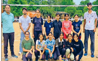
सतनाली मंडी। यदुवंशी स्कूल के विद्यार्थी।