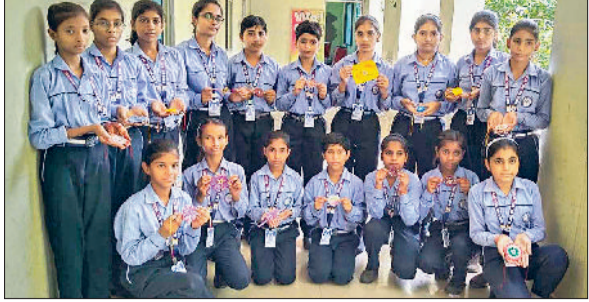
महेन्द्रगढ़। राखी दिखाती छात्राएं।

बचाव के उपाय क्या हैं। उन्होंने हेलमेट, ग्लव्स, मास्क, गैस डिटेक्टर व ऑक्सिजन सिलेंडर जैसे सुरक्षा साधनों के उपयोग की प्रक्रिया को भी समझाया।